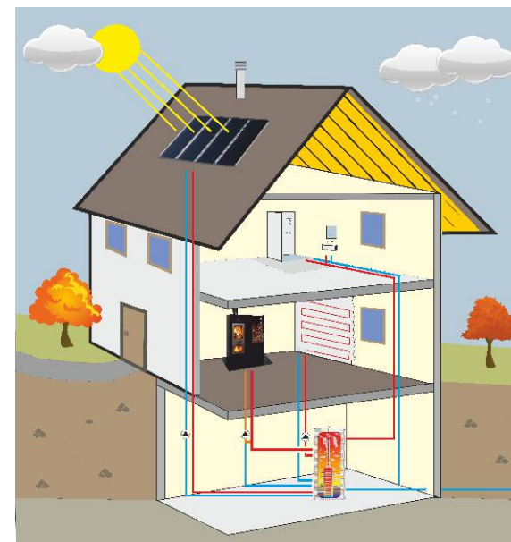
Impianto solare Wallnöfer con idrostufa Walltherm ed un accumulatore combi Logix24.